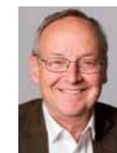
Y Cyngorydd Dyfrig Siencyn Arweinydd Cyngor Gwynedd

Yn fy marn i, ni fu erioed fwy o angen am lywodraeth leol gref. Mae ein cynllun corfforaethol newydd yn dangos sut y gallwn, fel Cyngor, weithio ar y cyd ar draws Gwynedd i ddarparu'r gwasanaethau sydd eu hangen fel bod pob un o'n trigolion yn byw bywyd da a diogel.